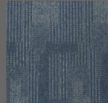
058 - Atlantis