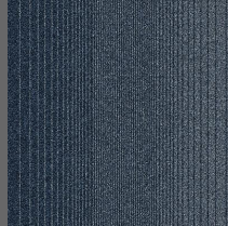
102 - Patagonia