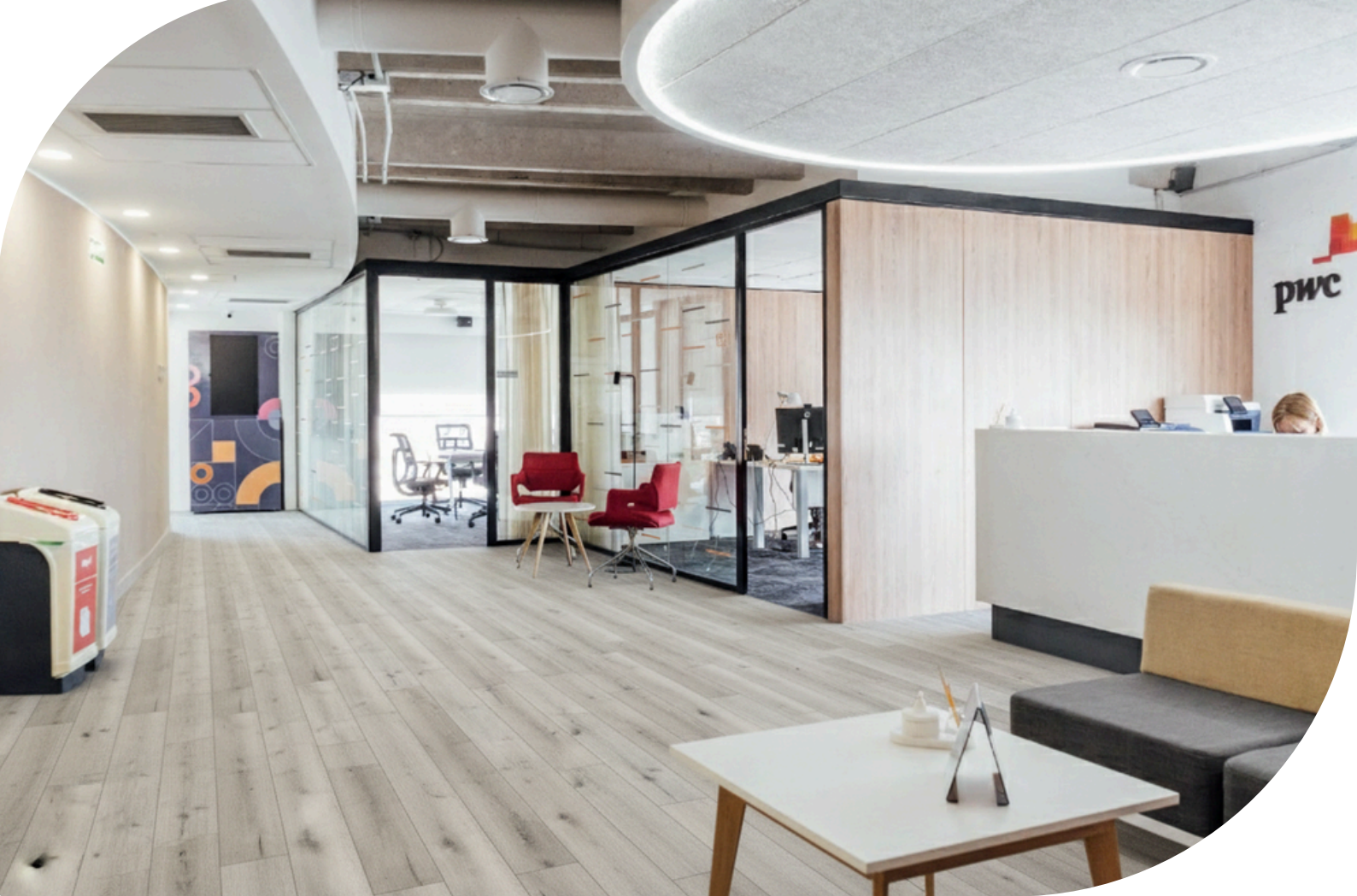
Greenfloor Loose Lay 4001