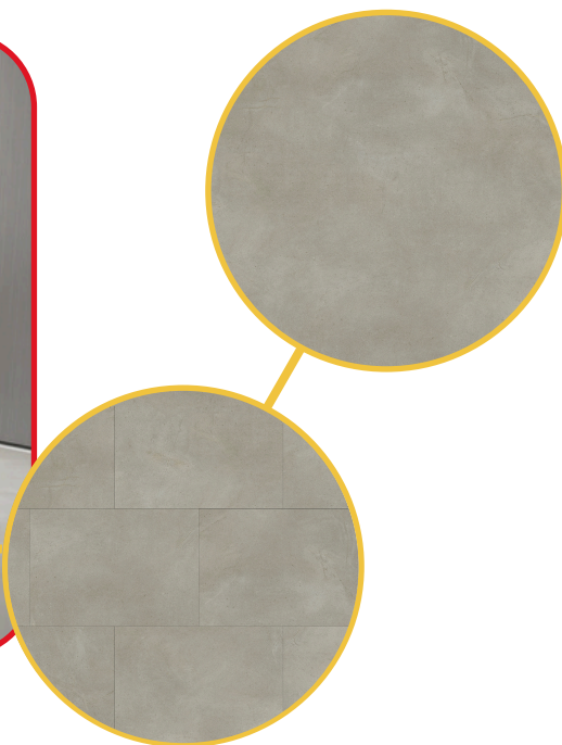
Cement & concrete 2085-10