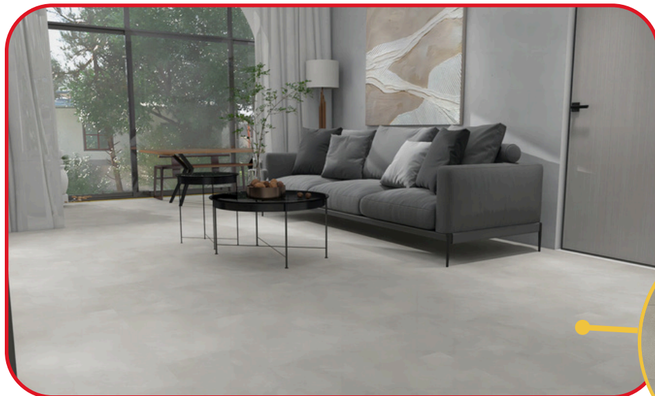
Cement & concrete 2085-05